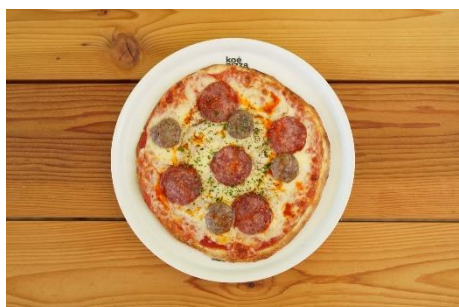
広島県広島市/ドットコミュのソーセージと 兵庫県南あわじ市/サラミのスパイシーピッツァ ¥1,800