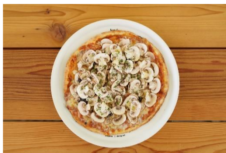
岡山県牛窓町/マッシュルームとにんにくのピッツァ ¥1,800