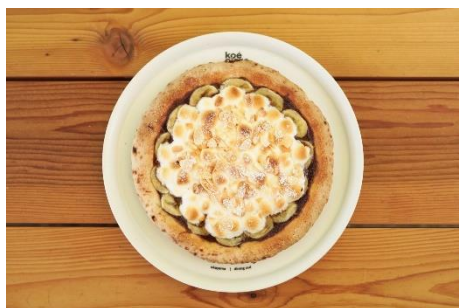
広島県尾道市/ウシオチョコラトルの チョコレートチャンクピッツァ ¥2,050 ※イートイン提供のみ