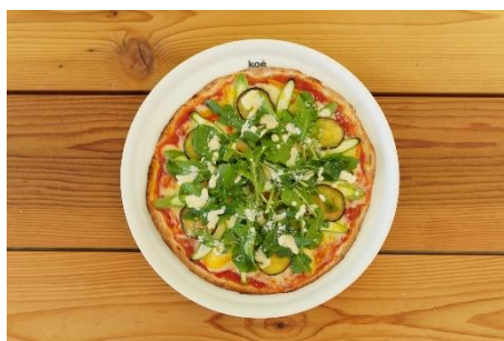
瀬戸内野菜のサラダ風ピッツァ ¥1,800