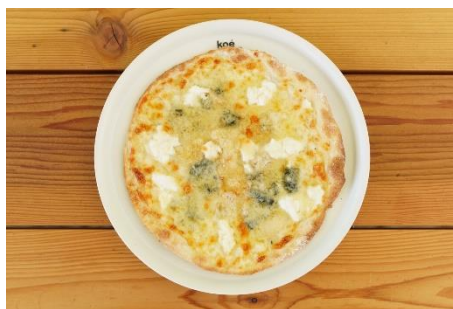
瀬戸内レモンはちみつのクワトロフォルマッジ ¥1,800