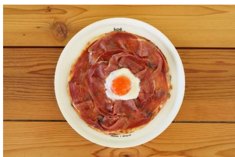
岡山県赤磐市/平飼温泉たまごと 兵庫県南あわじ市/生ハムのビスマルク ¥2,350 ※イトイン提供のみ