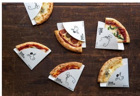
1/4 slice pizza (to go) ※テイクアウト提供のみ ・マルゲリータ ¥380 ・クワトロフォルマッジ ¥450 ・ソーセージ&サラミ ¥450