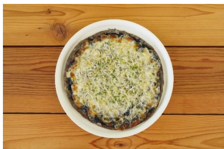
岡山産の白ネギと山利の釜あげしらすのピッツァ ¥1,800