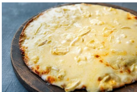
岡山県吉備高原/吉田牧場のチーズメルトピッツァ ¥2,500