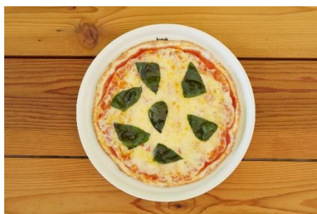
koe pizza の特製マルゲリータ ¥1,500